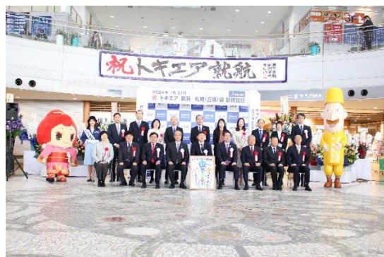
就航セレモニーの様子