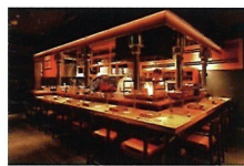
焼き肉割烹 よねくら 新潟駅前